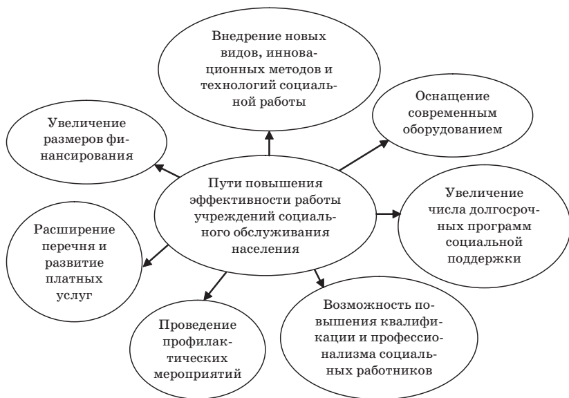
Рис. 3. Рекомендации по повышению эффективности работы учреждений социальной защиты населения

Специалисты и руководители отделов семейной политики и социального обслуживания семьи и детей предлагают в качестве перспективных направлений повышения эффективности такого обслуживания расширение перечня и развитие платных услуг, в том числе медицинских, открытие дневных форм стационара, тоже на платной основе. «Наше государство сегодня, к сожалению, не может позволить дальнейшее открытие стационарных учреждений».