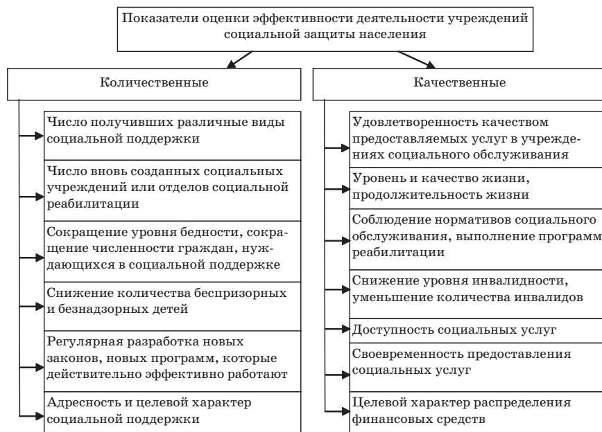
Рис. 2. Система показателей эффективности мероприятий социальной защиты населения

сокращения численности граждан, нуждающихся в социальной поддержке, снижения уровня инвалидности, уменьшения количества инвалидов, доступности социальных услуг, повышения профессионального и квалификационного уровня персонала социальных учреждений.